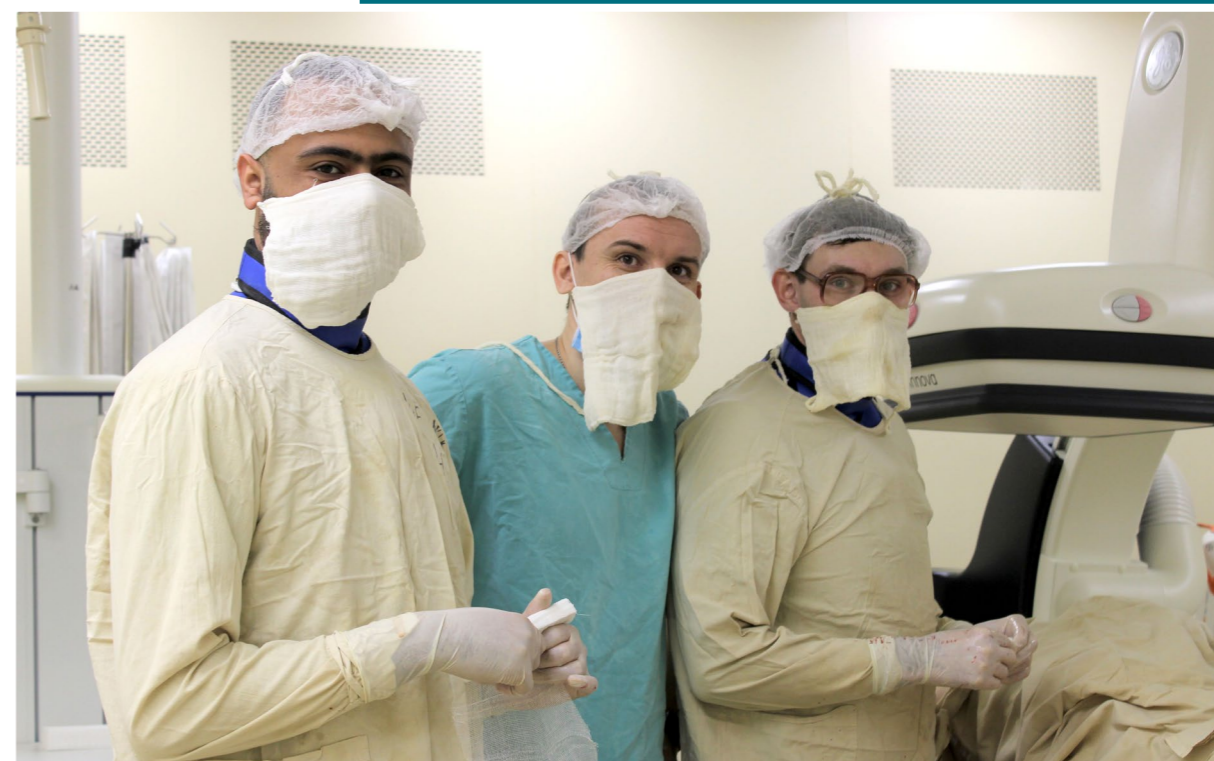
Молодые кардиохирурги в рентгеноперационной