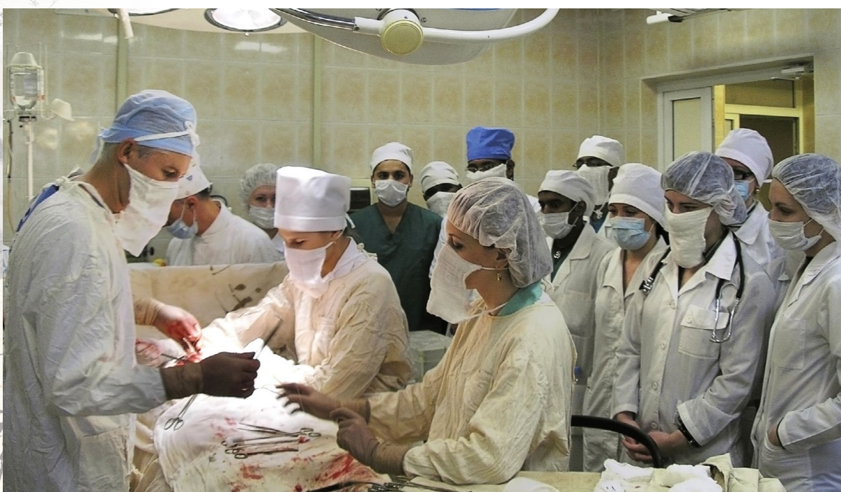
Иностранные студенты на практических занятиях по хирургии

Сотрудники кафедры являются постоянными участниками международных, республиканских и региональных конференций, а также активно участвуют в заседаниях областного научного общества хирургов, где выступают с докладами. На кафедре регулярно представляются к защите и защищаются диссертации на соискание научных степеней.