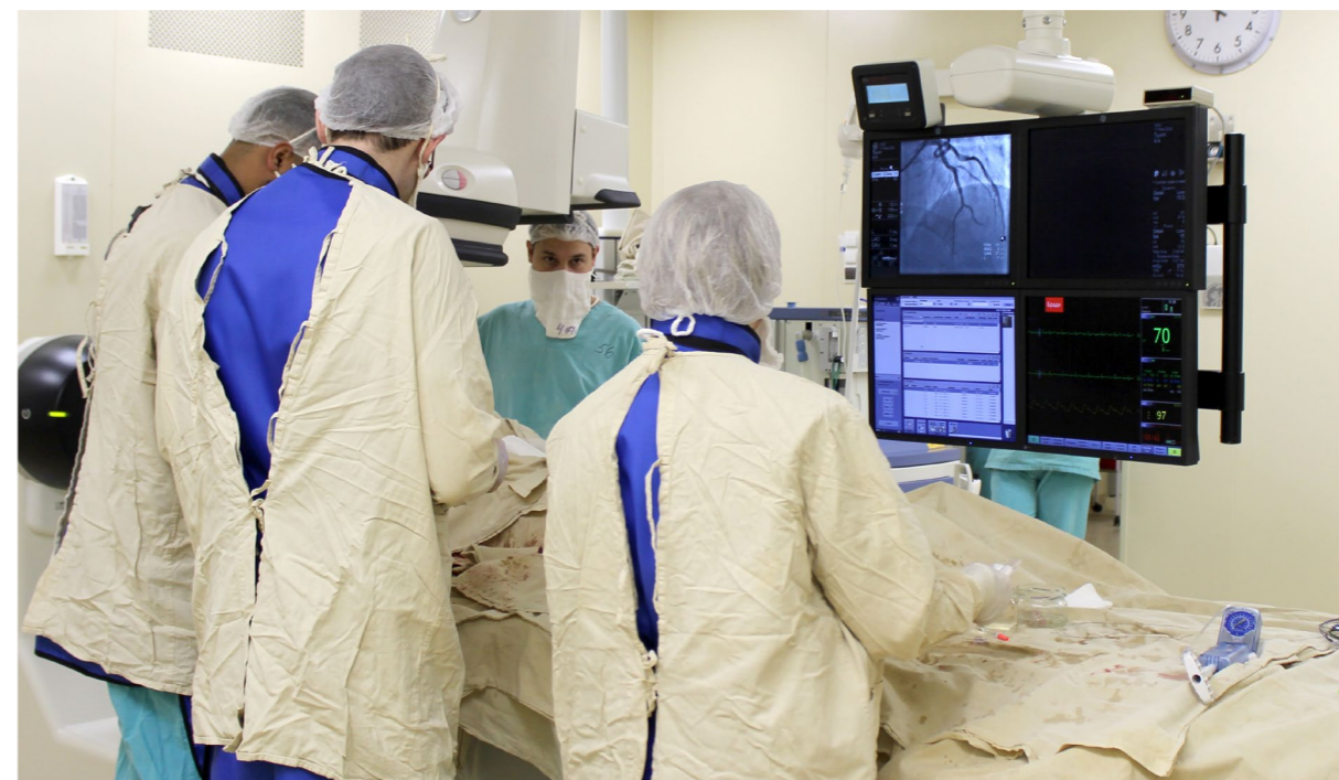
Операция по стентированию коронарных артерий

категории, многие из них — высшую, обладают значимым опытом работы, а также ведут совместную научную деятельность с Рязанским государственным медицинским университетом им. И. П. Павлова.